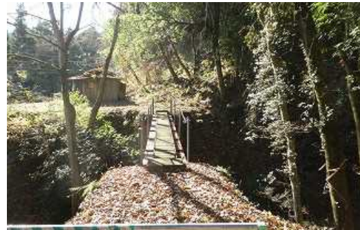
鉄橋の向こうは下仁田町 手前が富岡市

上信電鉄千平駅からさらに195号線を山間部へ進み、小坂坂峠と梅澤峠の分岐を下仁田方面へ500mほど進んだ県道の脇道を谷の方へ下りると、富岡市と下仁田町の境の大谷川（だいやがわ：通称 鬼ヶ沢）に架けられた鉄橋があります。